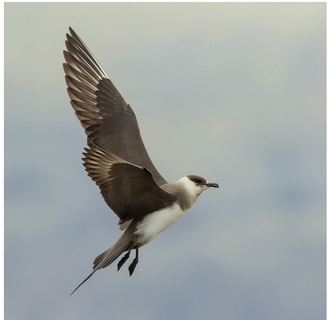
12. mynd. Kjóinn er mjög snöggur og fimur á flugi, sem kemur sér vel þegar hann stelur æti af öðrum fuglum, fyrirbrigði sem kalla má stelsníkjulífi (e. kleptoparasitism ).

Flughæfileikar og fimi kjóans koma ekki síst í ljós þegar hann eltist við aðra fugla, svo sem ritu, lunda ( Fratercula arctica ), kríu ( Sterna paradisaea ) eða fýl, þar til þau gefast upp og sleppa eða æla upp nýveiddri bráð, sem kjóinn grípur þá á flugi. Þetta er hans aðalleið til fæðuöflunar, fyrirbrigði sem má kalla stelsníkjulífi (e. kleptoparasitism ). Hann á auðvelt með að stunda þetta atferli á varptíma þeirra tegunda sem fyrir barðinu verða (á norðurhveli jarðar yfir sumarmánuðina, en á suðurhveli yfir vetrarmánuði). Hann á það þó einnig til að veiða sér sjálfur smáfiska og hryggleysingja og getur tekið egg eða unga annarra fugla, komist hann í aðstöðu til þess. 44 Stelsníkjulífi er ákaflega áhugavert fyrirbrigði og hefur verið talsvert rannsakað hjá þeim tegundum sem stunda þetta atferli. Margt bendir til þess að það sé greind