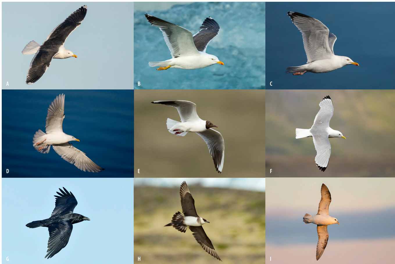
3. mynd. Samkvæmt gildandi lögum má einungis aflétta friðun á villtum fuglum í tveim tilfellum: Til að nytja tegundina með einum eða öðrum hætti eða til að bregðast við tjóni af þeirra völdum. Skjóta má 9 fuglategundir sem ekki eru nýttar, þ.e. svartbak (A), sílamáf (B), sílfurmáf (C), hvítmáf (D), hettumáf (E), ritu (F), hrafn (G), kjóa (H) og fyl (I). Miðað við skilyrði laganna mætti halda að þetta væru allt tegundir sem valda umtalsverðu tjóni. Því fer þó fjarri og er nauðsynlegt að endurskoða veiðiheilmildir á þessum tegundum og viðhorf til þeirra.

mörk ein eftir. Um 1911 voru einungis 1–2 þúsund sæotrar eftir á heimsvísu og var tegundin þá friðuð. 17 Hvernig gat hvarf einnar tegundar skýrt algjört hrun vistkerfisins? Í dag getum við svarað þeirri spurningu með vissu. Þótt sæotrar geti étið fjölbreytt sjávarfang eru þeir sérlega sólgirnir í ígulker, sem þeir sækja á sjávarbotninn og opna með því að brjóta þau með steini. 18,19 Þegar sæotrarnir hurfu fjölgaði ígulkerjum taumlaust og átu þau þarann þar til ekkert var eftir. Eftir friðun sæotranna tókst með eljusömu verndunarstarfi að stuðla að fjölgun þeirra á ný, sem hafði þær afleiðingar að ígulkerjum fækkaði og þarskógur uxu aftur. 17 Endurkoma þarskóganna hafði í för með sér endurkomu fjölda annarra tegunda og auðugs lífríkis, ásamt mikilvægri bindingu kol-efnis. 17,20-24 Sagan um sæotrana gefur okkur mjög skýra mynd af mikilvægi hlutverks rándýra í að halda stofnum bráðartegunda í skefjum. Viðkomandi bráðartegundir hafa þróast á löngum tíma með afráningu og hefur líffræði þeirra aðlagast því, þannig að ef afránið hverfur skyndilega eða minnkar geta hlutirnir farið úr böndunum.