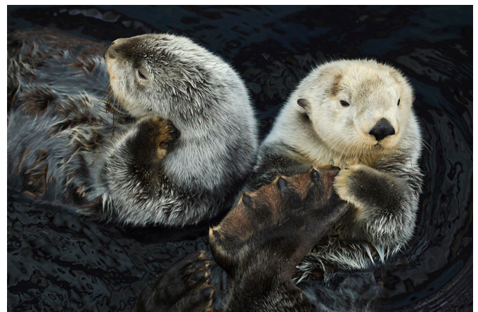
2. mynd. Sæotrar eru gott dæmi um sérlega mikilvægt rándýr ofarlega í fæðukeðjunni. Þeir gegna lykhillutverki í varðveislu þaraskóga við strendur N-Kyrrahafs með því að halda stofnum ígulkerja í skefjum. Á þessari mynd sést vel hversu aðlagaðir afturfæturnir eru sundi.

úlfar ( Canis lupus ), sæotrar ( Enhydra lutris ), kengúrurottur ( Dipodomys spp. ) og sléttuhundar ( Cynomys spp. ). 15 Tökum sæotra sem dæmi til að skýra hvernig þessi áhrif geta orðið (2. mynd). Sæoturinn hefur verið nefndur „verndari þaraskóganna“. 16 Talið er að hann hafi verið mjög útbreiddur áður fyrr og lifað við nær allar strendur N-Kyrrahafs. Honum var nærri útrýmt með veiðum, en skinnin voru afar eftirsótt á 18. og 19. öld. Þegar sæotrum fækkaði dróst útbreiðsla víðáttumikilla þaraskóga við strendur N-Kyrrahafs saman með tilheyrandi skelfilegum afleiðingum fyrir lífríkið í heild, þar sem þaraskógarnir veittu fjölmörgum fiskitegundum og hryggleysingjum bæði fæðu og skjól. Á mörgum stöðum sem áður höfðu hýst gróskumikið og fjölbreytt lífríki var eyði-