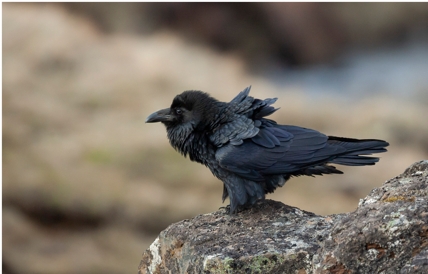
10. mynd: Hrafnar eru ákaflega áhugaverðir fuglar. Þeir hafa löngum þótt vera mjög greindir og hafa nýlegar vísindarannsóknir staðfest það. Viðhorf manna til hrafna hefur sveiflast töluvert í gegnum tíðina. Þeir voru mikils metnir í fyrri tíð en sættu síðar miklum ofsóknum á stórum hluta útbreiðslusvæðisins. Almenn til viðhorf til hrafna hefur færst til betri vegar í mörgum löndum í seinni tíð, nema e.t.v. á Íslandi.

annan og á meðal hrafna myndast flókin pólitísk tengsl vina og óvina, sem minnir helst á uppbyggingu einstaklingssambanda hjá simpösum og mönnum. 18,34,35,49,52,58,60-74 Reyndar er það svo að hrafnar og krákur standa sig stundum jafn vel og jafnvel betur en nánasti ættingi okkar, simpansinn, í að leysa ýmsar þrautir við tilraunaáðstæður, og hafa vísindamenn dregið þá ályktun að sennilega sé um að ræða samhlíða þróun ýmissa þátta greindar (þ.e. að ákveðið einkenni hefur orðið til oftast en einu sinni í þróunarsögunni, óháð öðrum tilfellum). 34,35,58,75,76