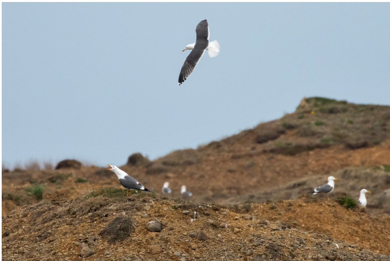
15. mynd. Sílamáfar á varpstað á Suðurnesjum. Sílamáfur, silfurmáfur, svartbakur og hrafn geta í einhverjum tilfellum valdið tjóni í æðarvörpum, en geta reyndar einnig verið æðarfugl fyrir afráni. Þessar tegundir má samkvæmt núgildandi lögum skjóta án nokkurra takmarkana, þ.e. hvar og hvenær sem er. Mjög hefur gengið á stofna þeirra síðustu ár og tjón sem þeir kunna að valda réttlætis síður en svo hömlulausar veiðar. Tímabært er að endurskoða viðhorf okkar til þeirra og binda skotveiðileyfi við friðlýst æðarvörp á varptíma.