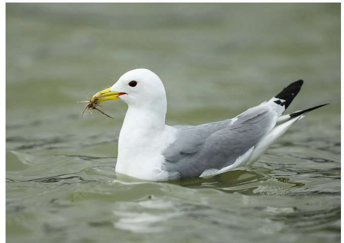
14. mynd. Rita er auðþekkanlegur máfur með frítt og góðlátlegt yfirbragð. Rita, fýll, hettumáfur og hvítmáfur valda ekki tjóni, hvorki í æðarvörpum né annars staðar, sem réttlætt getur skotveiðar á þeim. Slík heimild er tíma-skekka sem þarf að leiðrétta.

eða unga annarra fugla en sækja mjög lítið í æðarvörp og eru því mjög ólíklegir til að valda þar tjóni. 50,51 Hvítmáfur er auk þess mjög ólíklegur til að valda annars konar tjóni en hettumáfur verpur stundum nálægt flugvöllum og getur þar mögulega ógnað flugöryggi. Afturkalla ætti skotveiðiheimildir á hettumáf og hvítmáf. Ef bregðast þarf við mögulegri áflugshættu við flugvelli ætti þar að nota aðrar lausnir en skotveiði, svo sem fælur. 26 Kjói fer stöku sinnum í æðarvörp en þó er talið að tjón af hans völdum sé afar takmarkað. 50 Hann veldur engu öðru tjóni. Afturkalla ætti skotveiðiheimildir á kjóa. Þær veiðar sem leyfðar eru í dag bitna líklega helst á fullorðnum varpflugum 26 og það litla tjón sem hann gæti mögulega valdið réttlætir ekki veiðar á honum.