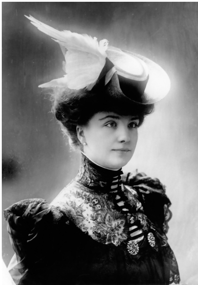
8. mynd. Fuglafjaddir og jafnvel heilir fuglavængir þóttu hið finasta hattaskraut kvenna á árunum 1850–1910. Ritur á Bretlandseyjum voru á meðal fjölda fugla sem veiddir voru í stórum stíl til að bregðast við eftirspurn tískuiðnaðarins. Hið virta fuglaverndarfélag RSPB (Royal Society for the Protection of Birds) var upphaflega stofnað af Emily Williamson í Manchester árið 1889 með það að markmiði að binda endi á notkun fjaðraskreytttra hatta.

og fjaðrir voru notaðar sem hattaskraut (8. mynd). Sennilega hefur sögulegu lágmarki í heimsstofnum margra máfategunda verið náð á seinni hluta 19. aldar og þótti mörgum þá orðið nóg um. Í kjölfar mikillar baráttu fuglavina voru lög og reglur settar í ýmsum löndum, sem höfðu það að markmiði að takmarka hömlulausar veiðar á fuglum, þar með talið mörgum máfategundum. Máfastofnar við Atlantshaf og víðar réttu úr kútnum frá því snemma á 20. öld til 1970–1990. Þeir stækkuðu mjög mikið á þessu tímabili og sumar tegundir juku útbreiðslu sína. Spilaði þar eflaust saman aukin vernd þessara tegunda og breytingar í fiskveiðiháttum okkar manna. Togaraveiðar juku framboð á slógi, sem kastað var í sjóinn, og brottkast hefur sennilega líka verið mikið á þessum árum. Þetta var auðveld fæða sem margar máfategundir nýttu sér. Þá er líklegt að fæðuframboð fyrir máfa hafi einnig aukist með aukinni neyslu manna og opnum sorphaugum ásamt ómeðhöndluðu skólpi sem veitt var út í náttúruleg búsvæði á þessum árum. Eftir 1980 fór þó aftur að halla undan fæti hjá mörgum máfategundum. Skýringu þess er að finna í samspili margra þátta. Farið var að vanda betur frágang sorps og skólps, en sennilega vóg þó mun þyngra að mörg lönd bönnuðu brottkast og gengið var æ meira á náttúruleg búsvæði sem hentug voru fyrir varp. Loks hafa lofts-