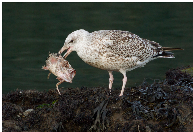
9. mynd. Máfar eru almennt séð fyrst og fremst fiskiætur en margir máfar éta sömuleiðis fjölbreytt úrval hryggleysingja. Stærstu máfategundirnar veiða einnig egg og unga annarra fugla í einhverjum mæli og einstakar tegundir geta jafnvel veitt sér fullorðna fugla eða lítil spendýr. Fæðuvejgur sumra máfategunda hafa síðustu öldina farið fyrir brjóstið á einhverjum, en hafa ber í huga að máfar gegna mikilvægu hlutverki í viðhaldi náttúrulegra vistkerfa. Tækifærissinnað fæðuval sumra máfategunda ber vott um mikilvæga aðlögunarhæfni, sem e.t.v. verður æ nauðsynlegri eigi tegundir að lifa af í breyttum mannheimi. Hér má sjá ungan svartbak með leifar af fiski.