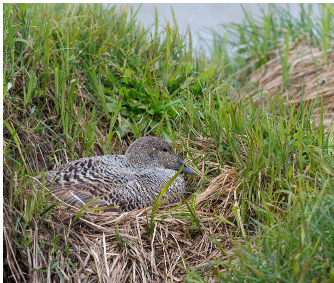
4. mynd. Æðarkolla á hreiðri. Til að verjast tjóni í æðarvörpum hér á landi, hófust á seinni hluta 19. aldar miklar aðfarir gegn sumum fuglategundum sem áttu það til að veiða egg eða unga æðarfugls eða fullorðna æðarfugla. Urðu haförn og svartbakur einna verst úti, þótt aðrar fuglategundir fengju líka að súpa seyðið af viðhorfi mannsins til fæðuvenja þeirra. Æðarrækt var þjóðhagslega mikilvæg á fyrri öldum og er hægt að sýna því skilning að menn hafi gripið til harkalegra aðgerða til að verja varpið. Enn er æðardúnninn mikilvægur fyrir einhverja einstaklinga en hefur þó alls ekki sama vægi fyrir samfélagið og áður.