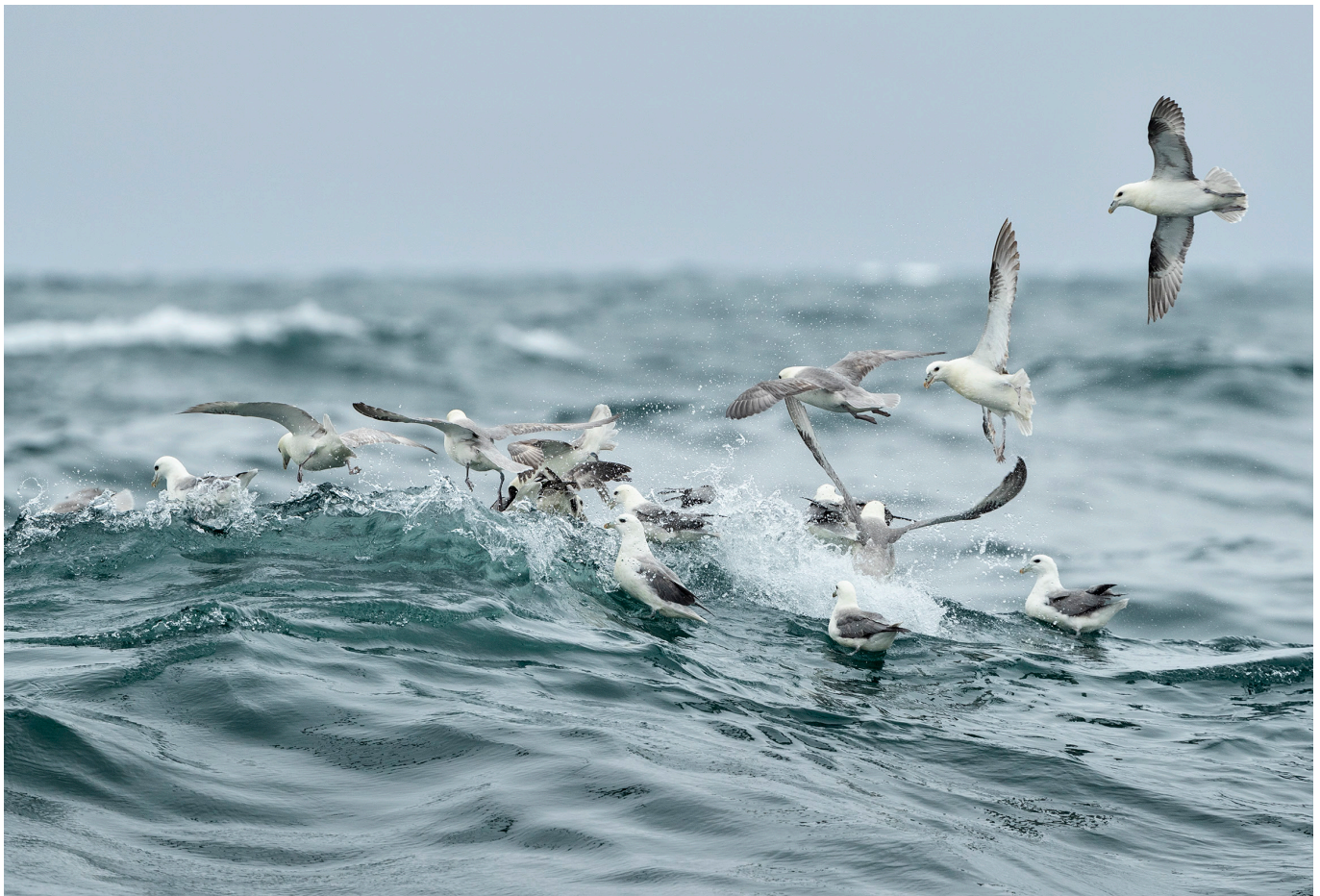
11. mynd. Sumir halda ranglega að fýll sé máfur en hann er pípunefur, eins og sést vel þegar að er gáð. Fýllinn hefur sérlega gott lyktarskyn sem hann notar m.a. til að þefa uppi æti. Fýllinn verpir oft á stórum, þéttum byggðum. Í einhverjum tilfellum er þær að finna dágóðan spöl inn til lands, þótt fýllinn sækir alla sína fæðu úr sjónum.

Fýll er sérlega langlífur fugl en alengt er að fýlar verði 30–40 ára eða eldri. Hann hefur varp mjög seint, eða um 9 ára gamall. Unglingsárunum eyðir hann að mestu á rúmsjó