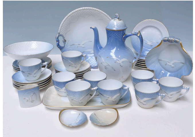
7. mynd. Hið danska máfastell þótti hið fínasta matar- og kaffistell stóran hluta 20. aldar í Danmörku, og náðu vinsældir þess einnig til Íslands að einhverju leyti. Það var framleitt af Bing & Grøndahl frá 1895 til 2011. Mynd: Bing & Grøndahl

Máfar eru tiltölulega langlífir fuglar og geta orðið u.þ.b. 20–35 ára gamlir miðað við núverandi þekkingu, sem byggir á endurheimtum á merktum einstaklingum. Langlífíð er aðeins mismunandi eftir tegundum en sennilega eiga þessar tölur eftir að hækka eftir því sem rannsóknum fjölga og aldursgreiningartækni fer fram. 43 Máfar verða kynþroska nokkurra ára gamlir. Minni tegundir reyna fyrst varp þegar einstaklingar eru 2–3 ára, en stærri tegundir þegar þeir eru 4–5 ára að jafnaði. Innan hverrar tegundar getur þó verið talsverður breytileiki í því hvenær einstaklingar hefja varp og getur sá munur numið þremur árum eða jafnvel meira. Unglingsárin fyrir varp eru mjög vel nýtt. Þá ferðast ungfuglarnir um, skoða gaumgæfilega mögulega varpstaði, kortleggja gjöful fæðusvæði og síðast en ekki síst reyna þeir að finna maka sem þeim líst vel á. Síðasti liðurinn er ekki síður mikilvægur en þeir fyrri, þar sem máfar eru einkvænifuglar og sýna almennt talsverða makatrygð. Þör halda þannig saman í mörg