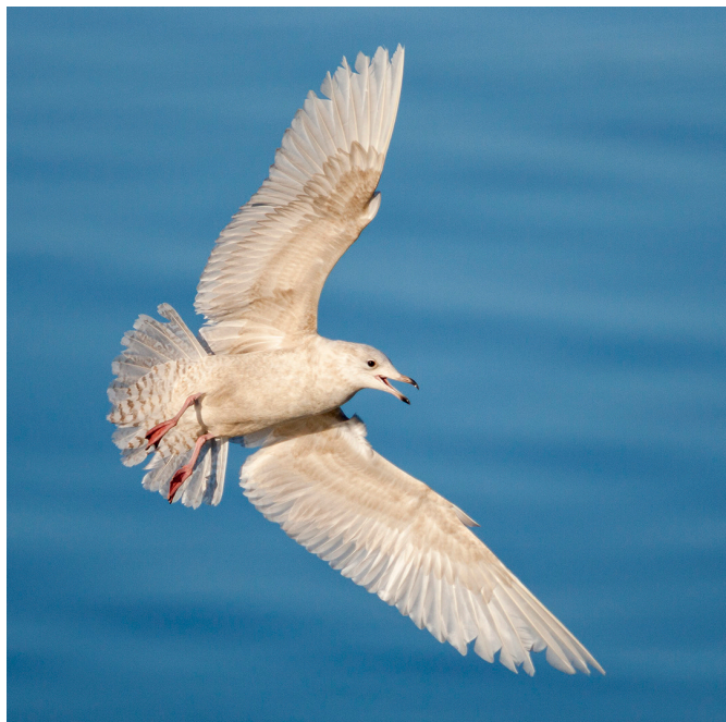
16. mynd. Bjartmáfur er hánorræn fuglategund sem dvelur á Íslandi á veturna. Honum svipar mjög til hvítmáfs og oft þarf töluverða reynslu og kunnáttu til að greina þá í sundur. Bjartmáfur er friðaður en er eflaust eitthvað skotinn í misgripum fyrir hvítmáf. Að ofan má sjá ungan bjartmáf á 2. aldursári.