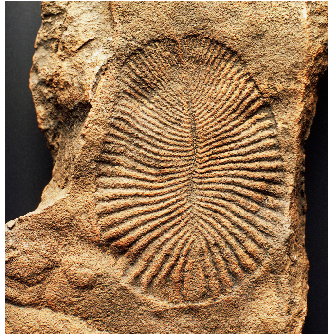
1. mynd. Steingervingur af Dickinsonia costata , sem uppi var á Ediakaran tímabilinu. Það tímabil stóð yfir í um 94 milljón ár og einkenndist af mjög einföldum dýrum. Með tilkomu afráns á Kambríum tímabilinu (sem hófst fyrir 541 milljón árum og tók við af Ediakaran tímabilinu) varð mikil breyting á dýralífi jarðar og grunnur lagður að þeim tegundum og þeirri fjölbreytni sem við þekkjum í dag.

Það er þó ekki einungis í baksýnispeglinum sem rándýr gegna mikilvægu hlutverki. Árið 1969 var hugtakið lykilttegund ( keystone species ) sett fram í fyrsta sinn. 14 Tilgangur hugtaksins var að reyna að ná utan um mikilvægi rándýra í vistkerfum með áhrifum þeirra niður fæðukeðjuna. Hugtakið hefur síðan verið útvíkkað og getur í dag átt við lífveru sem hefur óvenju mikil áhrif á heildarafdrif vistkerfis, þótt það sé ekki endilega efst í fæðukeðjunni. Þekktustu dæmin um lykilttegundir eru eftir sem áður dýr sem éta önnur dýr, s.s.