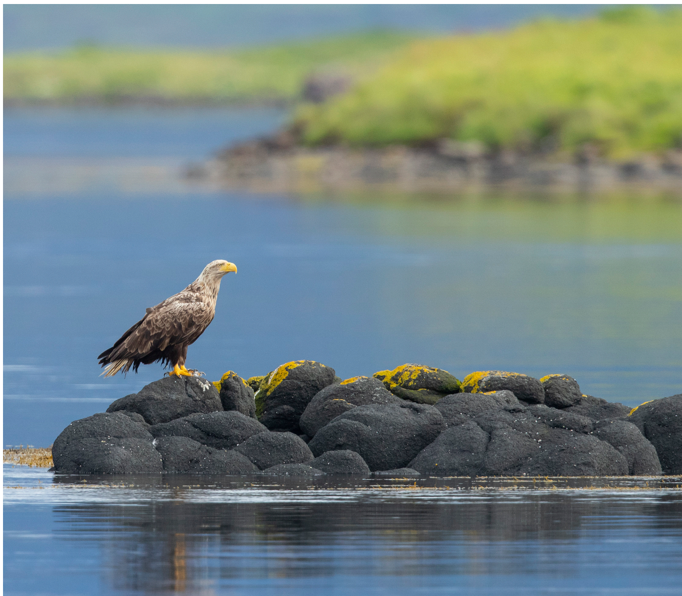
17. mynd. Þörf er á viðhorfsbreytingu gagnvart fuglategundunum 9 sem skjóta má án þess að þær séu nýttar. Mannmiðuð viðhorf og gildismat þarf að leggja á hilluna þar sem allar tegundir hafa eigið gildi, óháð hagsmunum mannsins. Okkur hefur tekist að breyta almenningsviðhorfi til hefðbundinna ránfugla, svo sem hafarna, úr neikvæðu í jákvætt. Nú er kominn tími til að gera hið sama fyrir óhefðbundnari ránfugla.