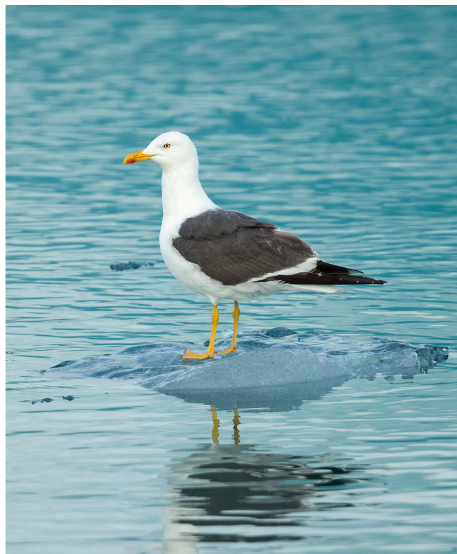
6. mynd. Vera má að máfar séu almennt séð dálítið misskildir sjófuglar. Mennt eiga oft erfitt með að greina tegundirnar í sundur og setja þá gjarnan alla undir einn hatt. Við höfum mögulega átt það til að finnast máfar svo sjálf-sagður hluti af umhverfinu að við höfum gefið þeim lítinn gaum. Máfar eru þó ákaflega áhugaverðir fuglar. Þetta er fjölbreyttur hópur með tilliti til atferlis og fæðuval, þótt þeir eigi líka margt sameiginlegt. Fullorðinn sílamáfur á Jökulsárlóni.

Vera má að einhverjum hafi ávallt verið í nöp við máfa frá því að fiskveiðar manna hófust fyrir þúsundum ára, þar sem hægt var að líta svo á að máfarnir væru í samkeppni við manninn. Slíkt viðhorf hefur þó síður en svo verið útbreitt og almennt hefur viðhorf til máfa verið jákvætt síðustu árþúsund. Í evrópskri þjóðtrú, allt aftur til Forn-Grikkja, voru máfar mikils metnir. Í einhverjum tilfellum var lítið svo á að máfar væru endurholdgaðir, drukknadír sjófarendur eða sálir þeirra. Í öðrum tilfellum var talið að þeir ferjuðu sálir sjómanna sem fórust á sjó til paradísar eða til lands. Máfar voruðu fólk við komandi illviðrum og leiddu sjómenn á gjöful fiskimið áður en nútímatækni tók yfir það hlutverk, þar sem hópur sjófugla á veiðum er merki um feng undir yfirborðinu. Máfar veittu sjómönnum félagsskap á löngum, einmanalegum dögum á sjó á litlum fiskibátum og sjófarendur treystu á köll ritunnar í fuglabjörgum til að rata í mikilli þöku. Af þessum sökum var víða í Evrópu bannað að drepa máfa hér